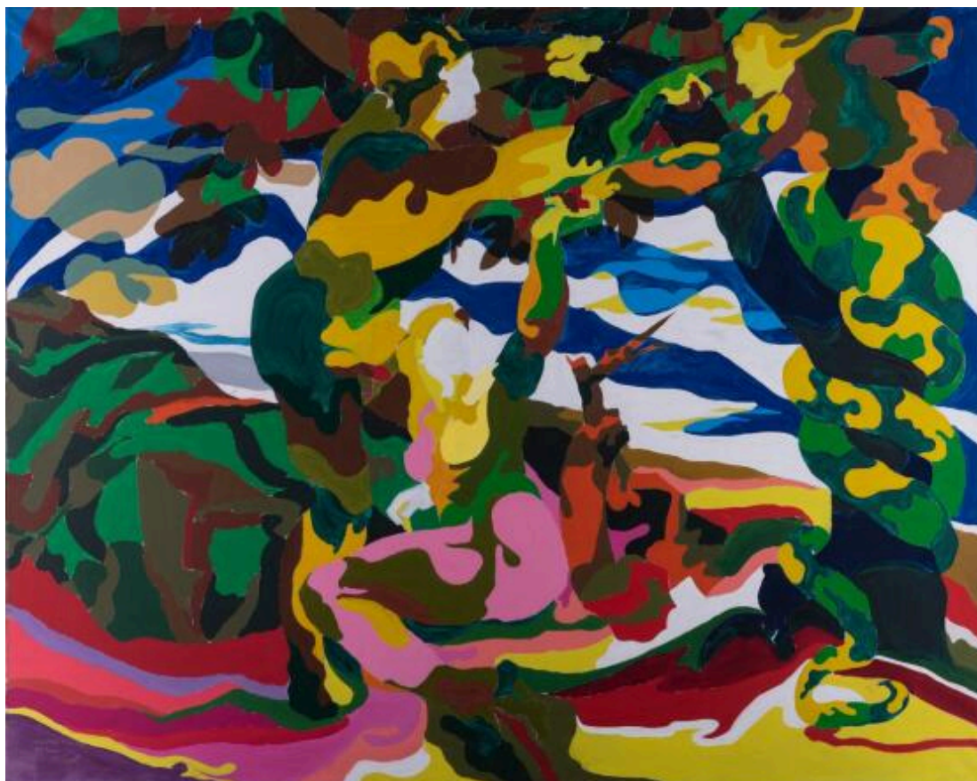
Alain Jacquet (1939-2008) Camouflage Michel Ange, Chapelle Sixtine, la tentation d'Eve, 1962-63 Huile sur toile.

Publié le 21 octobre 2019 à 06h00 · Lecture 3 min.